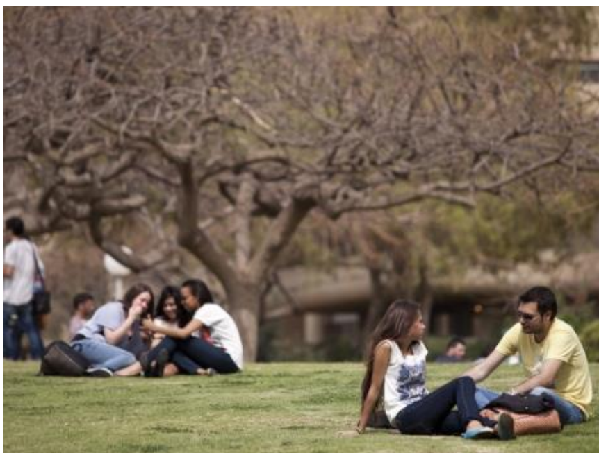
סטודנטים על הדשא באוניברסיטת תל אביב